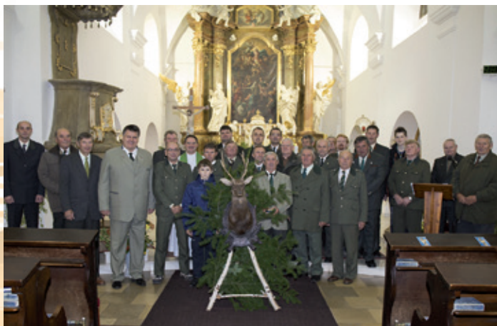
Svatohubertská mše svatá v kostele za účasti trubačů