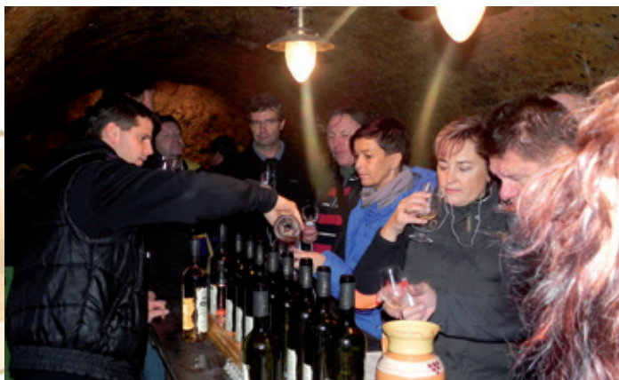
Svatomartinské otevřené sklepy, VIII. ročník