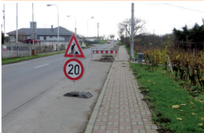
Ul. Brněnská – prodloužení chodníku