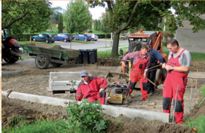
Ul. Bří Mrštíků – parkovací plochy u bytových domů