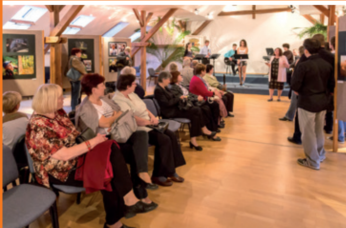
Vernisáž výstavy fotografií Slovenské pohledy 2014