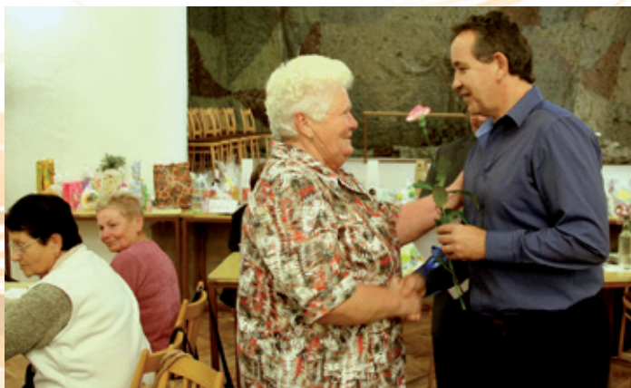
Výroční schůze Klubu důchodců s blahopřáním jubilantům