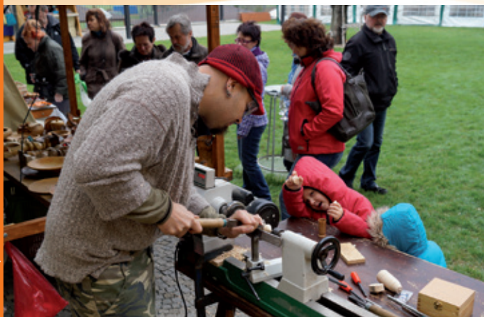
Ekocentrum Trkmanka – Premiérový Svatomartinský jarmark