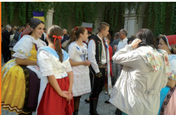
Schola Boží děčka ve Vídni, svátek sv. Václava