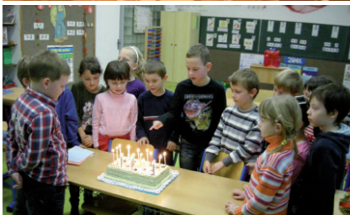
Prvníáčci slaví, dostali od pana ředitele Slabikář