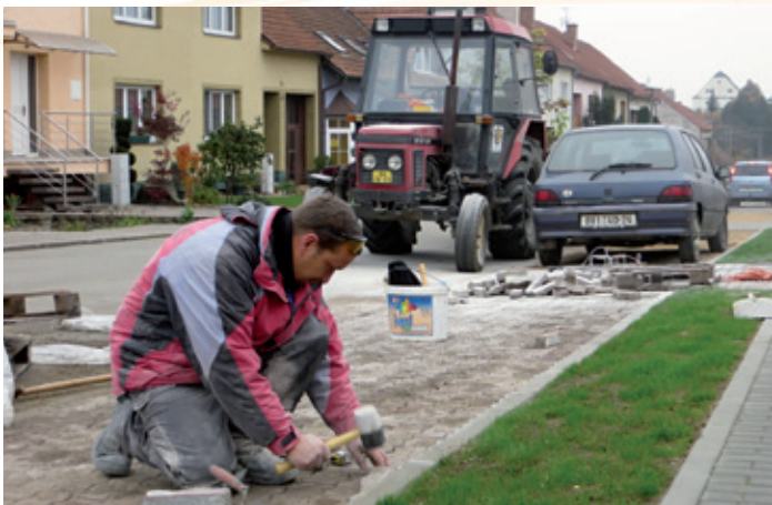
Ul. Dlouhá – parkovací místa podél vozovky