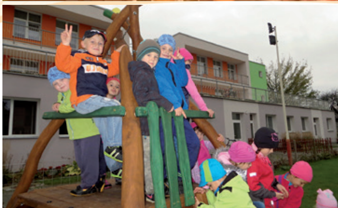
Nové herní prvky na zahradě mateřské školy