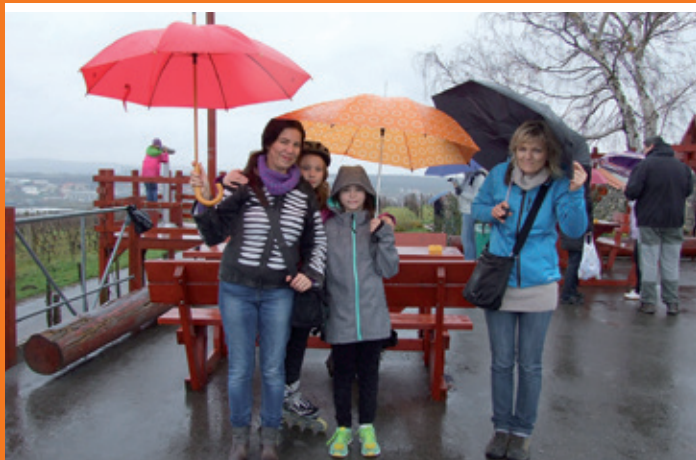
Podzimní Šlapka 2014 aneb Uzavření cykloturistické sezóny, VI. ročník