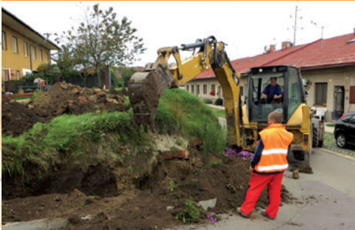
Tovární čtvrť – nové veřejné osvětlení