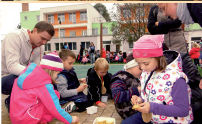
První velkolepá Bramboriáda ve školce