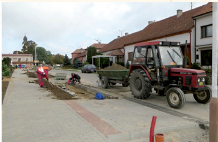
Ul. Dlouhá – nové předzahrádky a budování nájezdů k domům