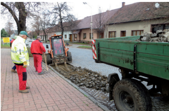
Ul. Hlavní – venkovní úpravy před budovou Sokolovny