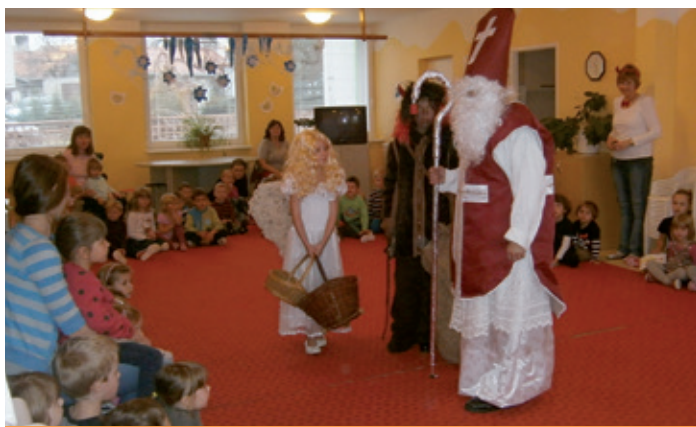
Mikulášská nadílka u nejmenších dětí, v mateřské škole

Spousty dalších fotografií a videoreportáží ze všech akcí najdete na oficiálních webových stránkách města Velké Pavlovice – www.velke-pavlovice.cz