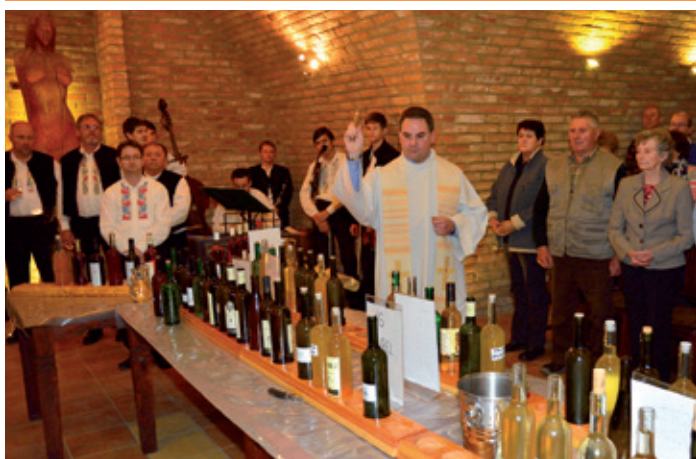
Žehnání mladému vínu ročníku 2014