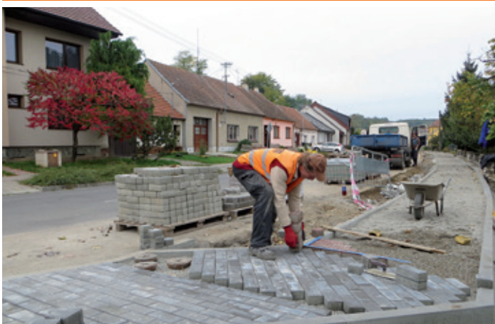
Ul. Pod Břehy – generální oprava chodníku