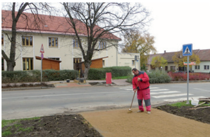
Ul. Brněnská – vstupy k posunutému přechodu pro chodce