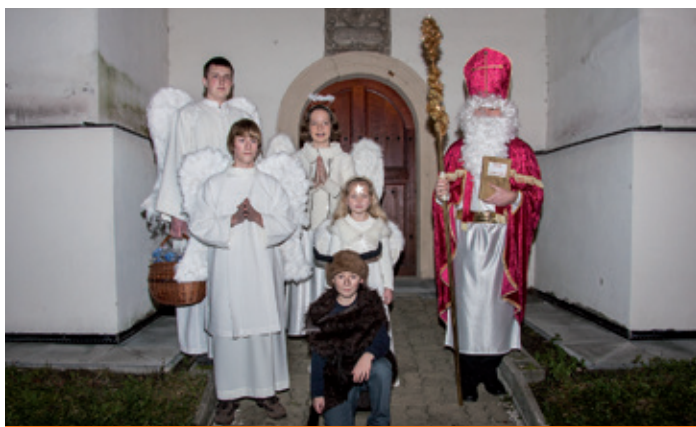
Advent je tu, městem chodila mikulášská družina