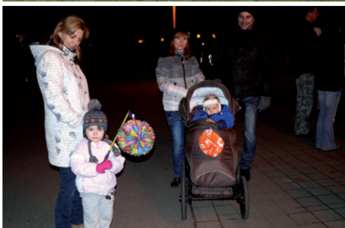
Lampiónový průvod při příležitosti oslav 17. listopadu, III. ročník